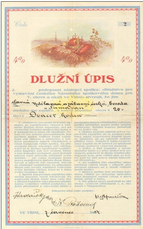
E6572 - Dluhopis krajanů ve Vídni vydaný 7.7.1914 na 20 K

Dalším novým cukrovarem v našich sbírkách je dílcová akcie „A“ vydaná Rolnickým cukrovarem akciovým v Hulíně. U této firmy jsou vlastně doposud známé pouze blankety a to celých akcií na 400 K a dílcových po 200 K. Doposud jsme měli ve sbírkách díl B, nyní se podařilo dokončit i díl A. Cukrovar byl založen v roce 1910 a tyto akcie jsou zakladatelskou emisí. Celkem bylo vydáno 3.500 akcií po 400 K, ale kolik z nich bylo rozděleno na dílcové doposud není jasné. To vše se bude publikováno až v katalogu cukrovarnického průmyslu, který je rozpracovaný a měl by vyjít jako 3. díl celé řady.