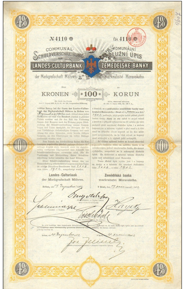
A2353 - Dluhopis Zemědělské banky na 100 K z roku 1902