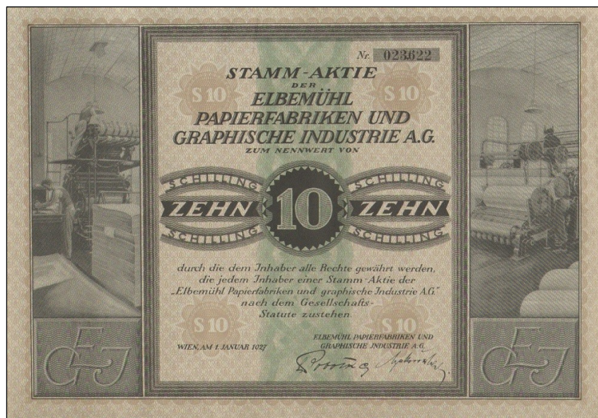
E6556 - Akcie Elbemühl Papierfabriken u. Graphische Industrie AG z 1.1.1927 na 10 ATS

Druhou novinkou je akcie rakouské Elbemühl Papierfabriken und Graphische Industrie AG vydaná ve Vídni 1. ledna 1927 na 10 šilinků, tedy nové měny, která po hyperinflaci nahradila rakouskou korunu.